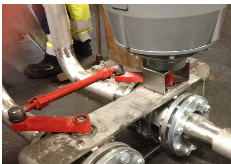
Über ein Gestänge werden gleichzeitig die beiden Armaturen für Zulauf mit Ablauf des jeweiligen Kühlsystems betätigt.